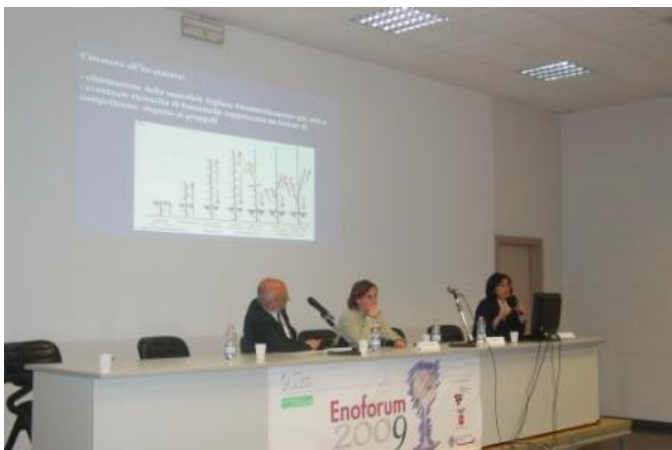
La presentazione del Fondo Ricerca SIVE (Fondo_Ricerca_SIVE.JPG, 1.1 MB)