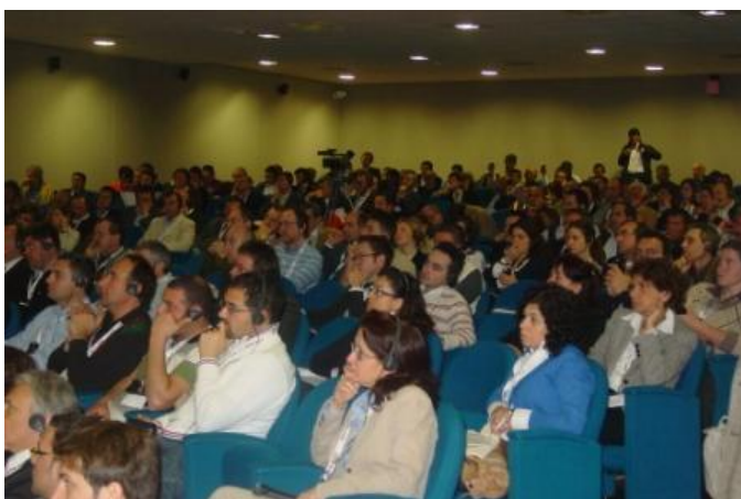
Il pubblico della sala Gutturnio, da 330 posti (Sala_Gutturnio_2.JPG, 1.34 MB)