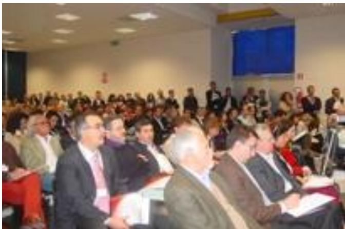
Il pubblico della sala Malvasia, da 120 posti (Sala_Malvasia_3.JPG, 1.32 MB)