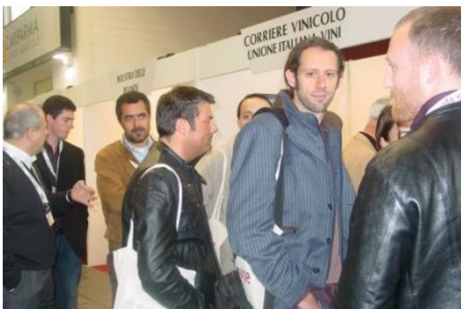
La galleria con i desk espositivi (galleria_desk_1.JPG, 1.36 MB)