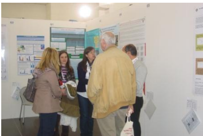
Discussione con gli autori presso lo spazio poster (Poster.JPG, 1.19 MB)

Tutte le foto in alta definizione sono disponibili a richiesta c/o Vinidea.